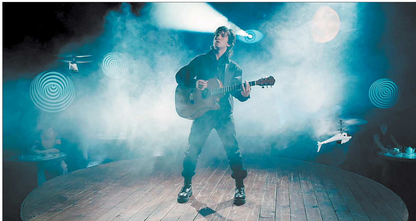
Двойник Виктора Цоя. Найдите отличия

Для проката фильм разделили: «Любовь и Дружба» и «Уважение и Сотрудничество» будут демонстрироваться на разных сеансах. Какую смотреть первой? Значения не имеет. Каждый из четырёх рассказов самостоятелен, несмотря на то, что новеллы связаны между собой: главные герои попадают в крымский городок в одно время и меняются местами с персонажами второго плана в других частях картины. Важно посмотреть всё. Иначе многослойность экранной истории останется за кадром. К тому же к концу фильма возникает стойкое желание его пересмотреть, потому что все действующие лица уже воспринимаются иначе. Они приобретают многогранность и глубину, превращаясь в живых людей и очень напоминают некоторых знакомых. А то, что поначалу выглядело вполне понятным и объяснимым, вдруг наполняется неожиданным смыслом.