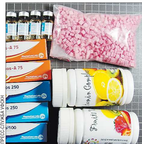
Изъяты «взбодрители» уже никому не пригодятся

Сотрудниками областного управления госнаркоконтроля пресечён почтовый канал распространения анаболических стероидов по области и в другие города России. По информации пресс-службы управления, в ходе спецоперации задержаны двое мужчин 1990 года рождения. Получая денежные переводы через банк, молодые люди отправляли своим заказчикам анаболические стероиды в обычных почтовых посылках и бандеролях. Один из злоумышленников выполнял функции организатора поставок действующих веществ (СДВ). Эти вещества (а также 80 тысяч рублей, 2 300 долларов, пять сотовых телефонов и I-Pad) были обнаружены и изъяты в его екатеринбургской квартире во время задержания. Его поодельник занимался распространением «товара». По версии областного УФСКН, три посылки с анаболиками он оформил в одном из почтовых отделений Первоуральска. В ходе его личного досмотра обнаружены и изъяты ещё не отправленные заказчиком четыре полимерных почтовых конверта с таблетками и 15 ёмкостями с жидкостью. По предварительной оценке, общий вес изъятых из незаконного оборота СДВ составил около 80 кг. В отношении задержанных возбуждено уголовное дело.