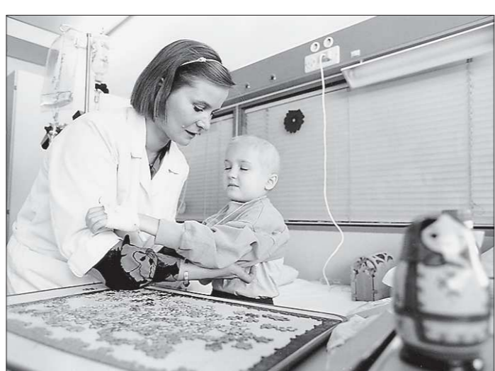
1992 год. Во время стажировки в клинике Гиссенского университета (Германия) уральские врачи решили создать свой высокотехнологичный центр онкогематологии...