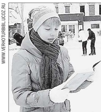
Время от времени участники акции скандировали: «Диван и стул не нужен мне – читаю даже на катке!»

Интересно, что самые маленькие участники – малыши из ясельной группы от двух до трёх лет – тоже старались самостоятельно приложить ручку к творчеству. Их фантазийные существа, наверное, получились самыми трогательными. Выставка действовала почти целый месяц, а сейчас все экспонаты украшают детсадовские комнаты.