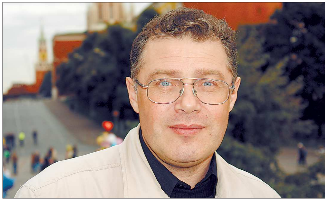
Александр Кердан, лауреат Большой литературной премии России, – автор 39 книг

ется, подвиг на учреждение литературной премии УрФО, областной микнульта – на издание «Библиотеки семейного чтения» (первые три тома уже стали библиографической редкостью), с администрацией Екатеринбурга учредили вместе всероссийскую премию имени уральского поэта-фронтовика В. Станцева... Сибиряки привезли на юбилей талантливую кинопародию на свой фестиваль «Люблю тебя» с А. Керданом в главной роли – а он и есть там ну ежели не главный, то «один из»: один из организаторов и сопредседатель жюри... Челябинцы, наряду с серьёзными подарками, вручили юбиляру единственную в своём роде и с большим смыслом медаль «За всё», потому что только на Южном Урале А. Кердан – «защитился» и стал доктором культурологии, написал гимн институту, привёл во многие учебные и трудовые коллективы коллег-писателей, сделал эти встречи традицией... Друзья-афангацы искренне благодарили юбиляра за верность военной теме в творчестве (люди воинского долга – главные герои А. Кердана), а курганцы, вручая «Антологию зауральских писателей» (здесь и стихи полковника А. Кердана), не без смысла шутили: «Стихи из этого сборника проходят бы на уроках литературы с названием: «Дети, среди полковников есть не только «нехорошие дяди из военкоматов», но и настоящие поэты». Есть. Зал сообража вспомнил российских