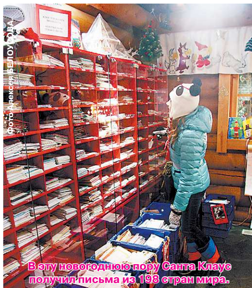
В эту новогоднюю пору Санта Клаус получил письма из 198 стран мира.

потолком тикает огромный часовая механизм. По массивной лестнице поднимаешься вверх – в гостиную. На пороге встречает гном в красной шапке с помпоном и проводит вглубь комнаты. Там на огромном деревянном стуле сидит Санта Клаус – добродушный старичок в очках с длинной и кудрявой белой бородой, в красном костюме и невероятного размера валенках.