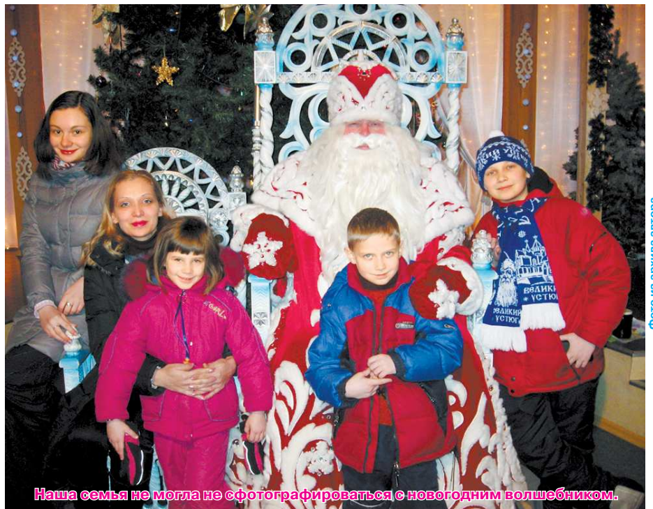
Наша семья не могла не сфотографироваться с новогодним волшебником.