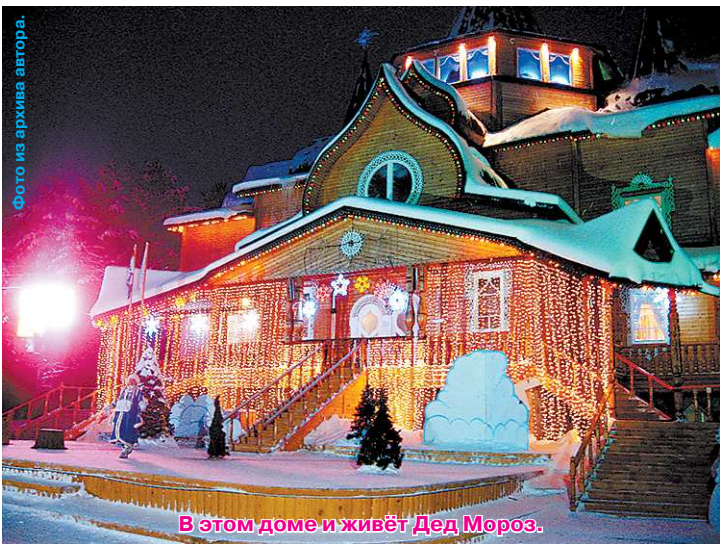
В этом доме и живёт Дед Мороз.