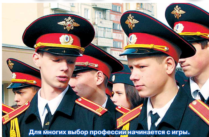
Для многих выбор профессии начинается с игры.

Участниками заочной игры выступают команды (юнармейские отряды) образовательных