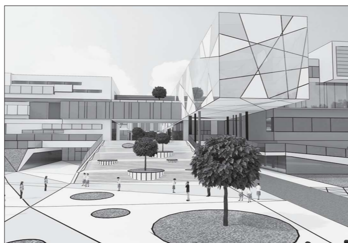
Гимназия «Корифей» единственная из всех участников конкурса приложила к концепции еще и эскиз – получилось довольно фантастично