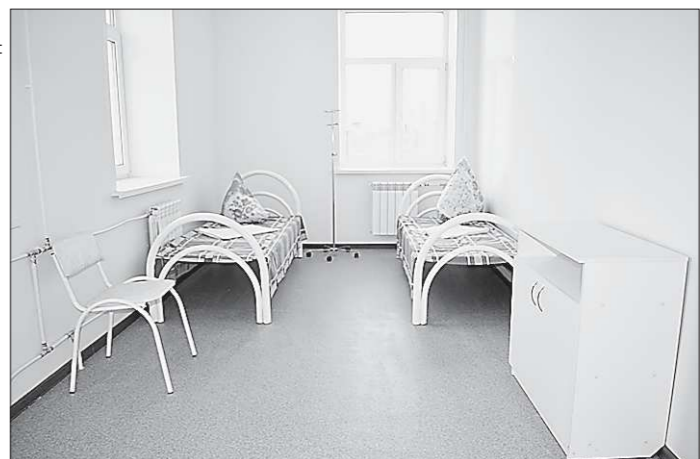
От старого здания сохранились только несущие стены, все остальное – кровлю, перекрытия между этажами, полы, оконные проемы, инженерные сети и внутреннюю отделку помещений строители сделали заново

Общеврачебную практику (ОВП) на три врачебных участка открыли в поселке имени Чкалова, районе Каменска-Уральского, сообщает официальный портал города. Внутри здания – кабинеты врачей, палаты дневного стационара, процедурные и комната здорового образа жизни. ОВП полностью готова к работе, а первичный прием пациентов медики начнут уже на этой неделе.