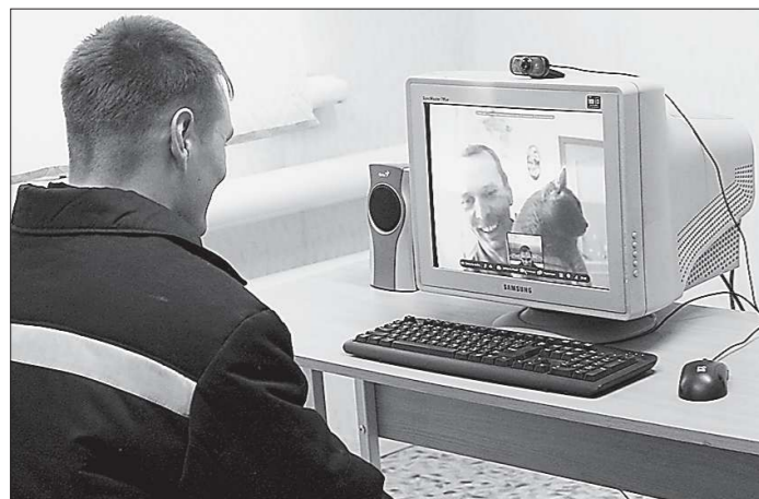
Видеосвязь может оказаться для многих заключённых и их близких единственным способом повидаться. Так что желающих воспользоваться ею, очевидно, будет достаточно