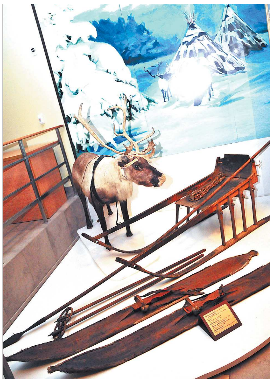
И лыжам, и нарте, и хорено (жердь погонная) — более ста лет, а пользоваться можно и в XXI веке. Ручная работа

Слово «соседей» вообще очень точно характеризует новую экспозицию. Во время открытия выставки прозвучали и другие слова: «наша сила в нашем умении жить вместе...». Более ёмкого объяснения сути проекта не подобрать. Урал — родина многих народов. На территории Свердловской области мирно живут представители ста тридцати национальностей. Читай — культуру, обычаев, ритуалов... На выставке чум соседствует с юртой, мордовская лодка для рыбы с лодкой манси, уникальная мансийская вышивка — с не менее самобытной мордовской, коми-пермяцкой женский костюм с удмуртским и русским... Отойдите на два шага, отвлечитесь.