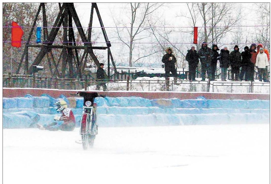
Бывает и такое: «железный конь» устремился к финишу, даже потеряв седока