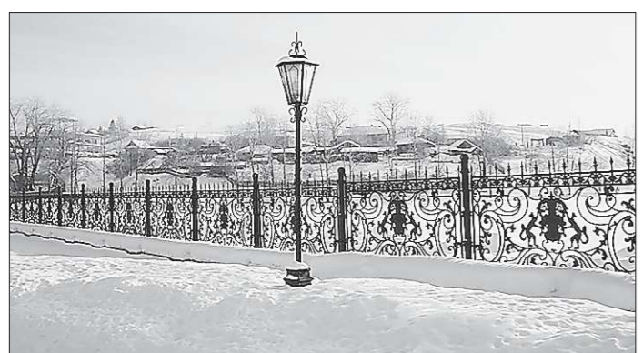
Новые фонари будут не такие красивые, как этот, стоящий в центре Невьянска, но зато свет от них будет наверняка ярче

К слову, и старые фонари не выброшены на помойку. Их устанавливают на городских окраинах. Конечно, вид у светильников советского образца не столь нарядный, но люди, до сей поры добравшиеся до дома в потёмках, рады и такому освещению.