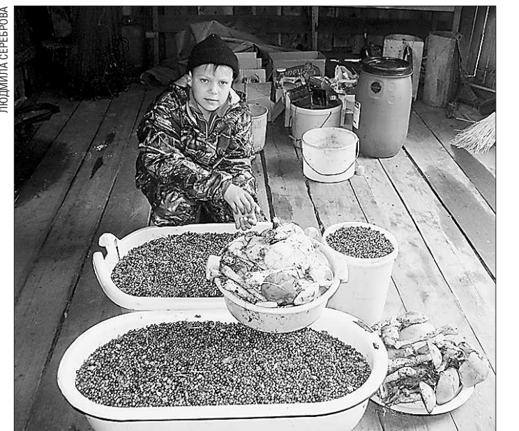
В этих местах лес всегда помогал кормиться и жить

В начале 1930-х годов Всеволодо-Благодатское было приписано к Ивдельскому мансийскому национальному району.