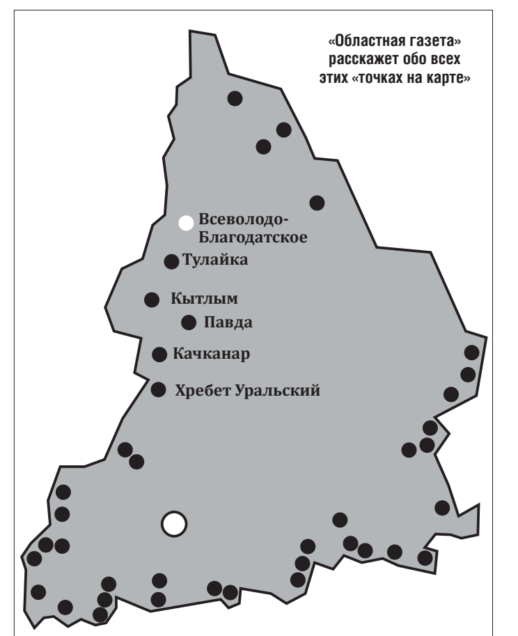
«Областная газета» расскажет обо всех этих «точках на карте»

В селе прописано 240 человек, хотя по-стоянно проживает около 130. Большинство работоспособных сельчан трудятся за пре-делами Всеволодо-Благодатского – вахтовым методом, на шахтах СУБРА, на предприя-тиях и в организациях Североуральского го-родского округа.