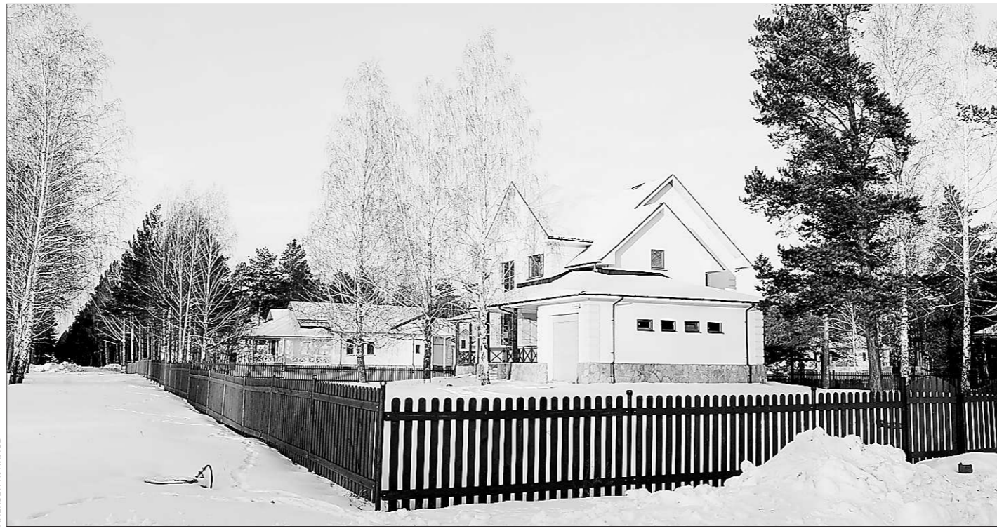
Тринадцатую часть стоимости дома (если она – не выше 2 миллионов рублей) государство вернет вам по вычету

В основном, работодатели не испытывают негатива к сотрудникам, которые втайне ведут поиски работы – 61 процент опро-