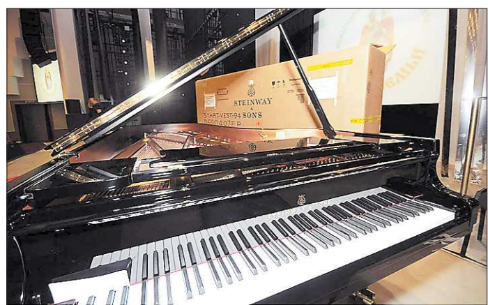
О таком роуле в Театре эстрады мечтали с момента основания

Появился качественный инструмент благодаря губернатору А.Мишарину. И не какой-нибудь, а представитель знатной фамилии – «Стейнвей энд сонс» – «Стейнвей энд сонс». Инструмент ручной работы – детище фирмы, которая на протяжении века держит марку отличного среди лучших.