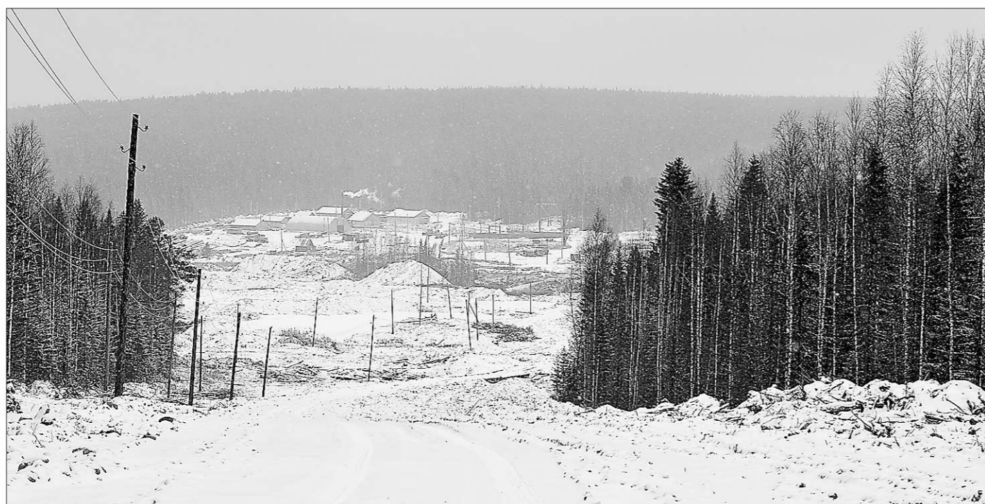
Посёлок старателей на речке Тулайке