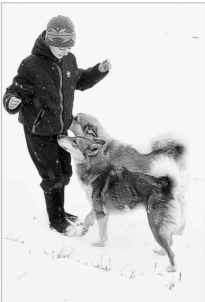
Лайки из Тулайки