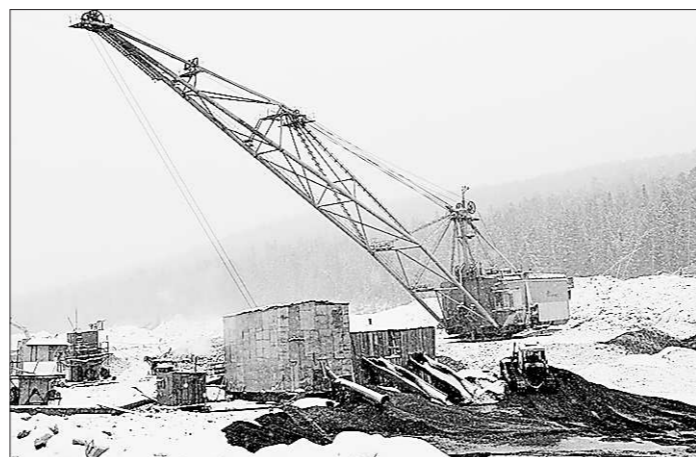
Экскаваторно-гидравлический комплекс – начало золотого потока

тая в состав Уральской горной компании (УГК) сохранила название в духе традиций: «Артель старателей «Южно-Заозёрский прииск». Но это совсем другие старатели. Они похвально отзываются о подведомственной им технике. Особенно драглайн нравится. Он вокруг себя может взять площадь 120 м в диаметре. И надёжный, год ходит без большого ремонта. К бульдозерам, правда, отношение сдержанное: ломаютесь!