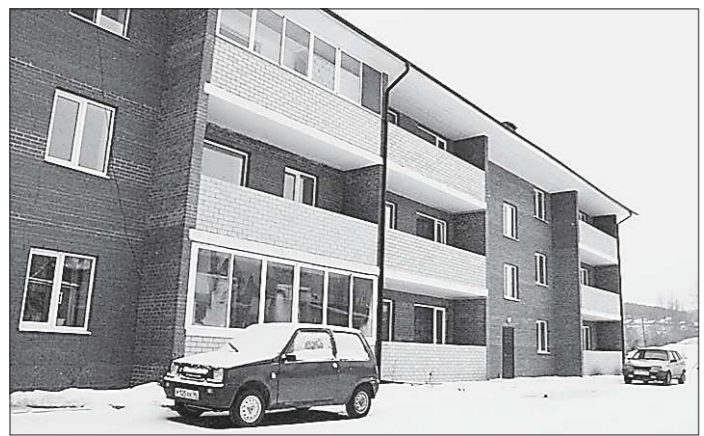
В течение ближайших недель, как обещают чиновники, все документы на собственников будут оформлены. Новый год ветераны и сироты встретят в новом доме

В 2013 году ещё один такой же планируют построить рядом с другим крупным полигоном – Северным.