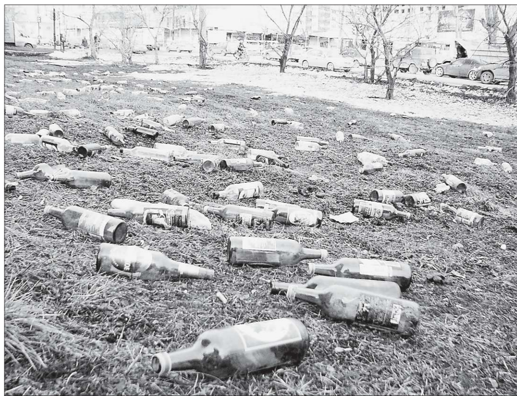
Этот снимок сделан в самом центре Екатеринбурга. Если сейчас не принять мер, мы буквально зарастем грязью