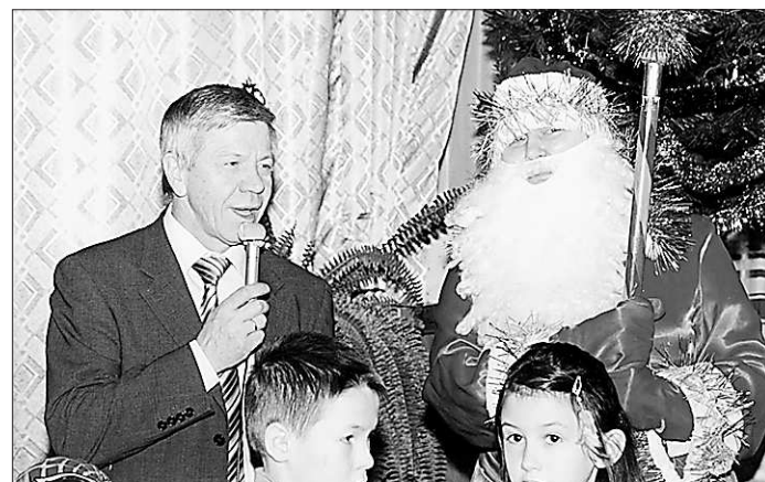
Воспитанники детского дома – самая большая сердечная боль и забота главы округа

– У меня трое любимых детей и две любимые внучки. Старший сын, к несчастью, погиб вместе с женой в автомобильной аварии. Второй сын – предприниматель, третий – студент. Оба живут в Екатеринбурге. Дочке 12 лет, каждый день она провожает и встречает меня с работы. Это такое счастье, когда дома ждут дети.