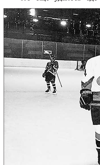
«В хоккей играют настоящие мужчины...» Даже если выйти на лёд удаётся только в редкие минуты отдыха

– Вы автор двух научных изданий. О чём ваши книги?