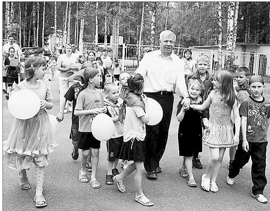
108 тысяч человек – население округа. В том числе – тысячи детей. Глава округа для них – всё равно что второй папа. Или дедушка

– В 2006 году в Москве я защитил докторскую диссертацию по теме «Концептуальные основы региональной промышленной политики». Книжки также по этой теме. Главное, что, по моему мнению, нужно нам сделать – принять федеральный закон о промышленной политике в стране. Он должен поставить приоритеты в развитии всех отраслей экономики. А пока средства выделяются по просьбам – сегодня Петрову помогли, завтра Иванову, всё хаотично.