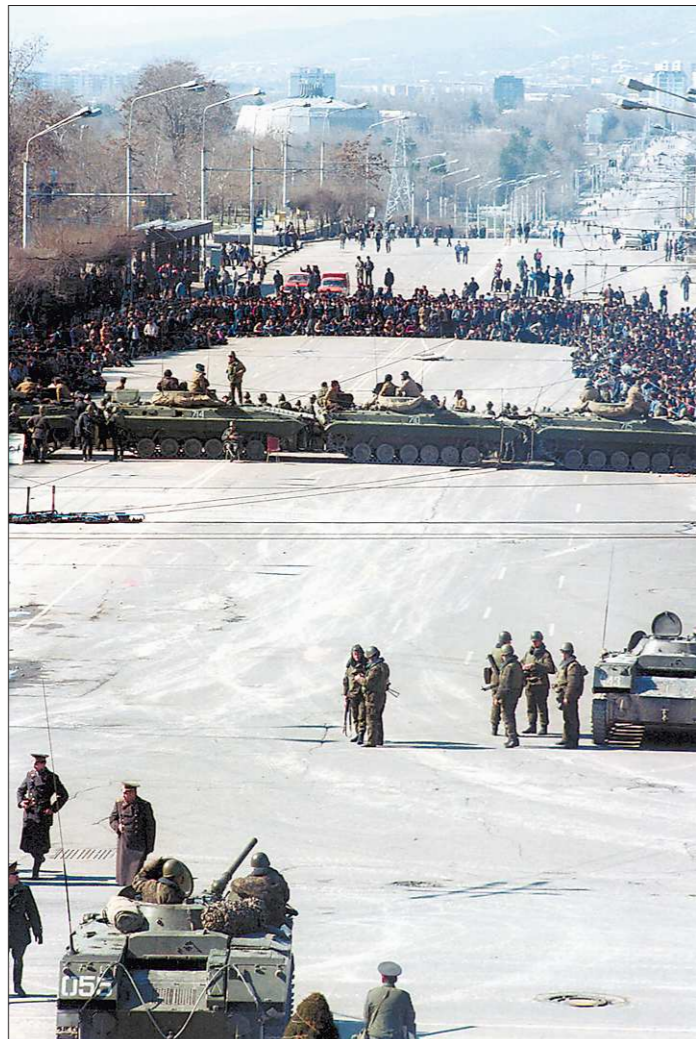
Февраль 1990 года. После массовых беспорядков в Душанбе было объявлено чрезвычайное положение и введён комендантский час. На снимке: противостояние армии и жителей города

При этом участниками митинга фиксировались и активно комментировались ещё и итоги всукраинского опроса,