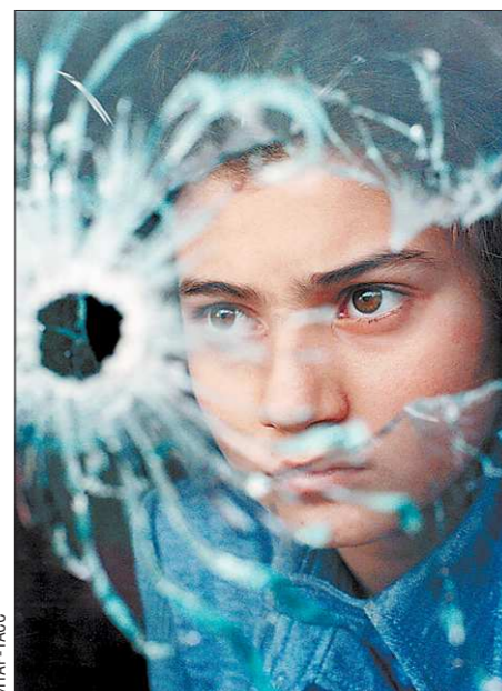
Резкое обострение ситуации в Баку в начале 1990 года вынудило союзные власти объявить в городе чрезвычайное положение. Этот снимок сделан 22 января – через два дня после того, как в столице Азербайджана были введены войска