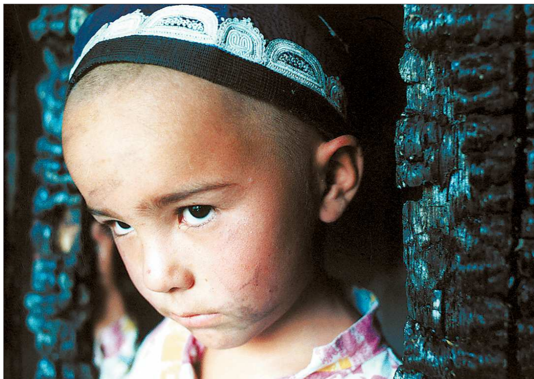
Июнь 1990 года. В киргизском городе Оше произошли кровавые межнациональные столкновения. На снимке: ребёнок, оставшийся без крова после тех событий