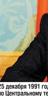
25 декабря 1991 года Президент СССР Михаил Горбачёв выступает по Центральному телевидению с заявлением о своей отставке