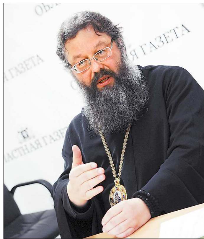
Митрополит Екатеринбургский и Верхотурский Кирилл