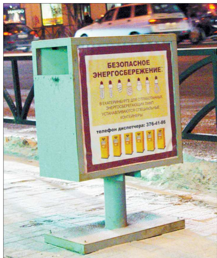
Такие контейнеры уже появились в разных районах Екатеринбурга

Как известно, лампочки Ильича (так называемые лампочки накаливания) уходят в прошлое. В соответствии с законом РФ «Об энергосбережении и повышении энергетической эффективности», их производство начали сокращать уже с этого года. А к 2014 году оно будет прекращено полностью. На смену придут, да и уже вовсю приходят так называемые энергоберегающие. Они имеют более дли-