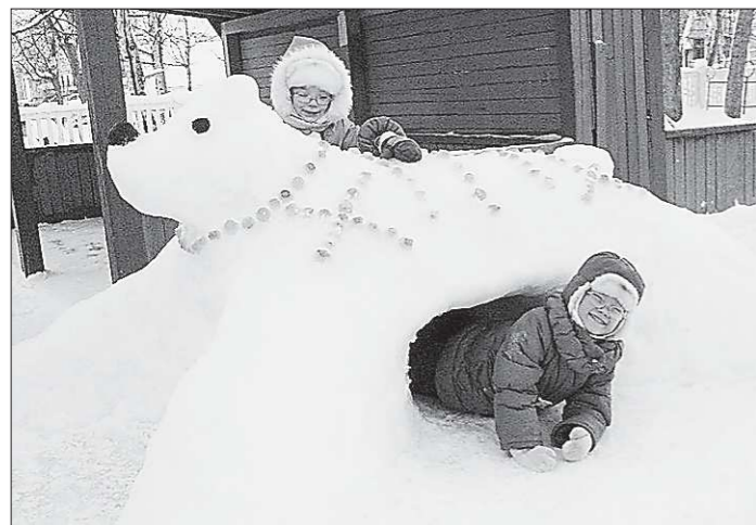
По опыту прошлых лет конкурс на лучшую дворовую горку добавляет Нижней Салде до десяти снежных мини-городков