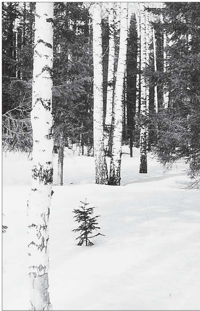
Еловые леса в области занимают площадь около двух миллионов гектаров. Из них более 750 тысяч гектаров — спелые ельники, готовые для рубки. Пальму первенства по количеству еловых лесов держит Карпинск. На втором месте Ивдель. На третьем — Шаля

На одного человека может быть выписано не более трёх штук. Стоимость деревца до метра — 28 рублей 53 копейки, до двух — 57 рублей 6 копеек, до трёх — 85 рублей 61 копейка, до четырёх — 114 ру-