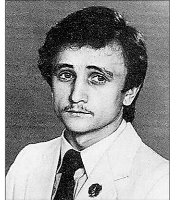
...и в 1980-м