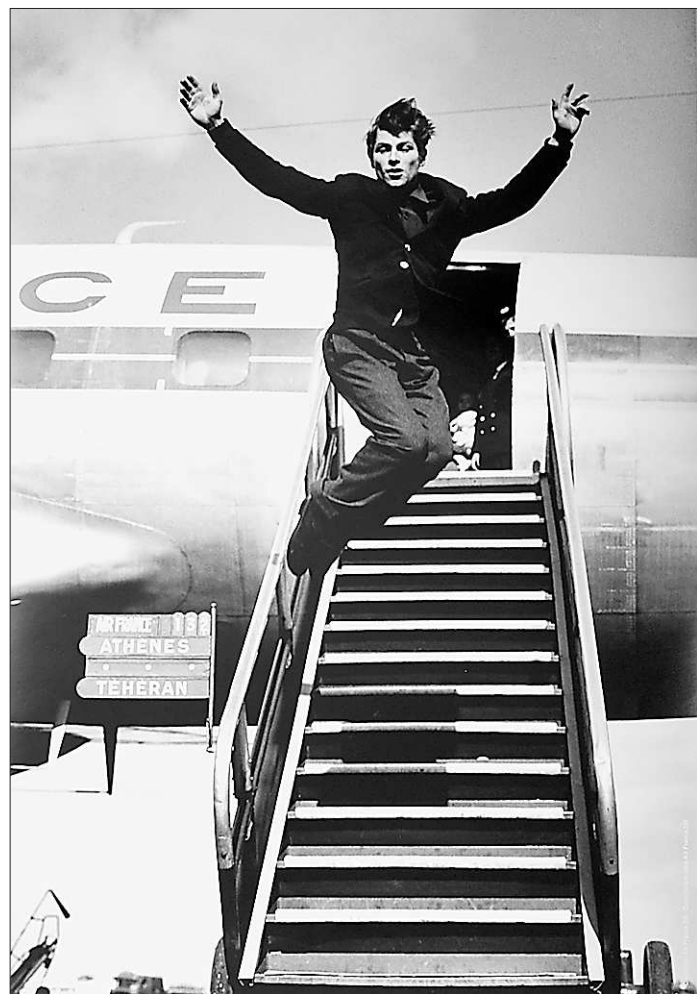
В полёте — великий танцовщик Жан Бабиле

Перелет участников экспедиции из Москвы в Исламабад запланирован на 9 декабря. Оттуда вертолётном ВВС Пакистана альпинисты отправятся в базовый лагерь на Чогори. Само восхождение планируется начать в декабре 2011 года и завершить в марте 2012 года.