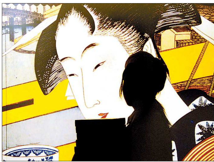
Фоторазмышление о слиянии прошлого и настоящего

50-е прошлого века — начало эры авиаперевозок, в воздухе — большие винтовые лайнеры. У