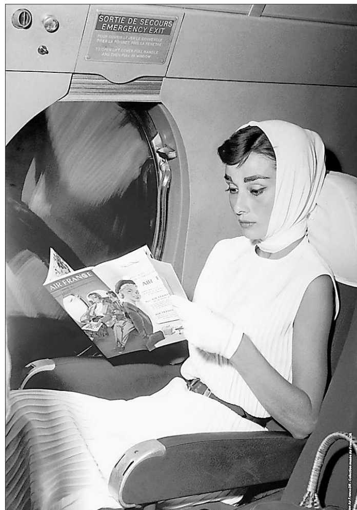
Неподражаемая Одри Хепберн