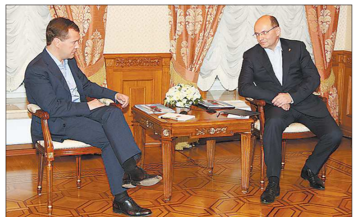
Президент обсудил с губернатором наиболее острые проблемы развития Свердловской области

мита ШОС и заканчивая нынешней заявкой на проведение ЭКСПО-2020) сделали попросту невозможным дальнейшее затягивание метроостроительства. Но проблемы касались не только денег. Напомним, ранее в декабре ожидалось открытие сразу двух станций — «Ботанической» (в районе торгового центра «Дирижабль») и «Чкаловской» (около Южного автовокзала). Когда буквально все, даже совсем пессимистично настроенные горожане, поверили, что 1 декабря на платформу «Ботанической» ступит нога первого пассажира, как гром среди ясного неба грянуло — «Не готовы эскалаторы. Придется подождать».