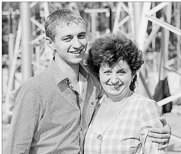
Двое из династии на стройке