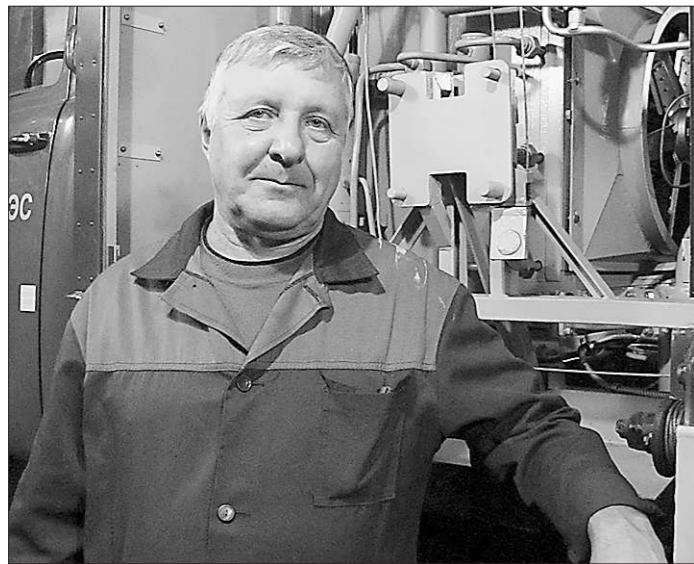
У Попова не забалуешь