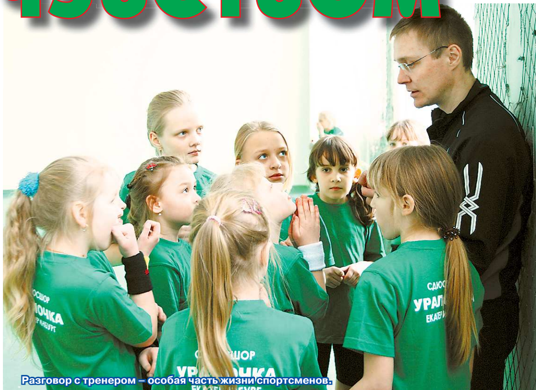
Разговор с тренером — особая часть жизни спортсменов.