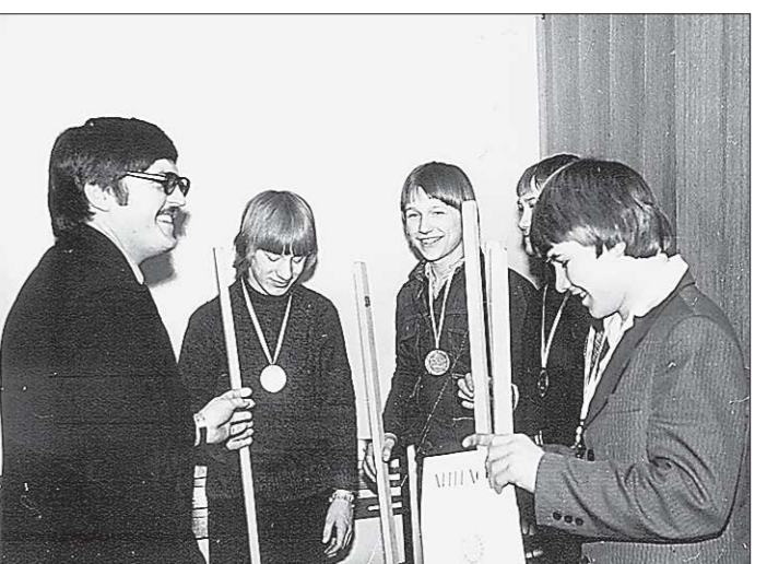
Спортивное братство помогает в общении с любимым возрастом