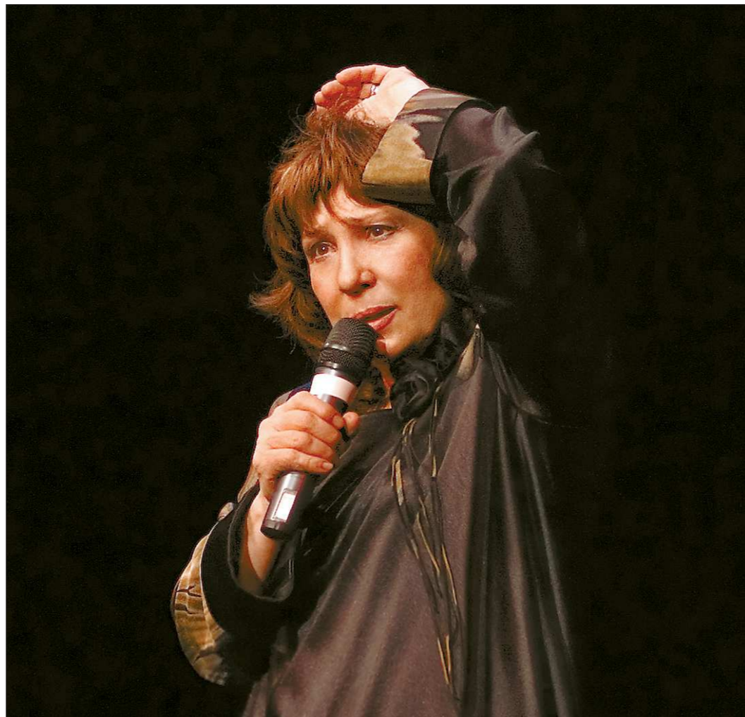
Невозможно поверить, что ей — 71...

—Трудно примириться с этим. Но трудно и не зарыться. Именно так понимаю сменившиеся ориентиры — как болезнью. Посмотрите на детей, их улыбки — какими чистыми, духовно здоровыми они рождаются. А