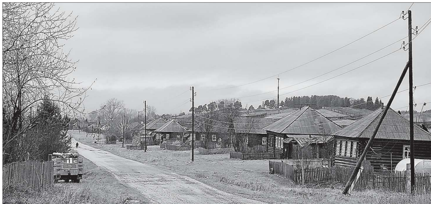
Главная улица Павды

Наконец дорога втягивается в широкую улицу, застроенную старыми, но крепкими пятистенками под четырёхскатными крышами. Это Павда. Похожесть местной архитектуры можно объяснить и традицией – здесь не принято крыть жилые дома «по-банному», в два ската. Кроме того, бывали времена, когда новые дома вырастали взад, между улицами – на песке золотом и платиновом. Это когда старательский фарт пойдёт: местная невеликая речка подарит богатую золотую россыпь или в соседнем