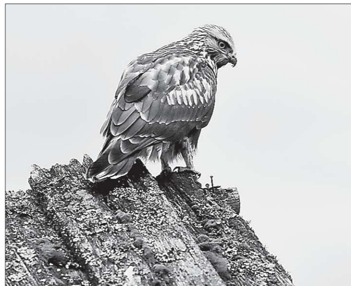
Страж исторического тракта