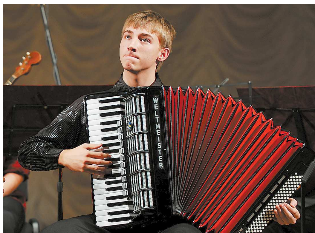
Чтобы полюбить народные инструменты, нужно услышать их. Хотя бы один раз

Профессиональные исполнители (отчасти в шулку, отчасти всерьёз) предлагают народные инструмен-