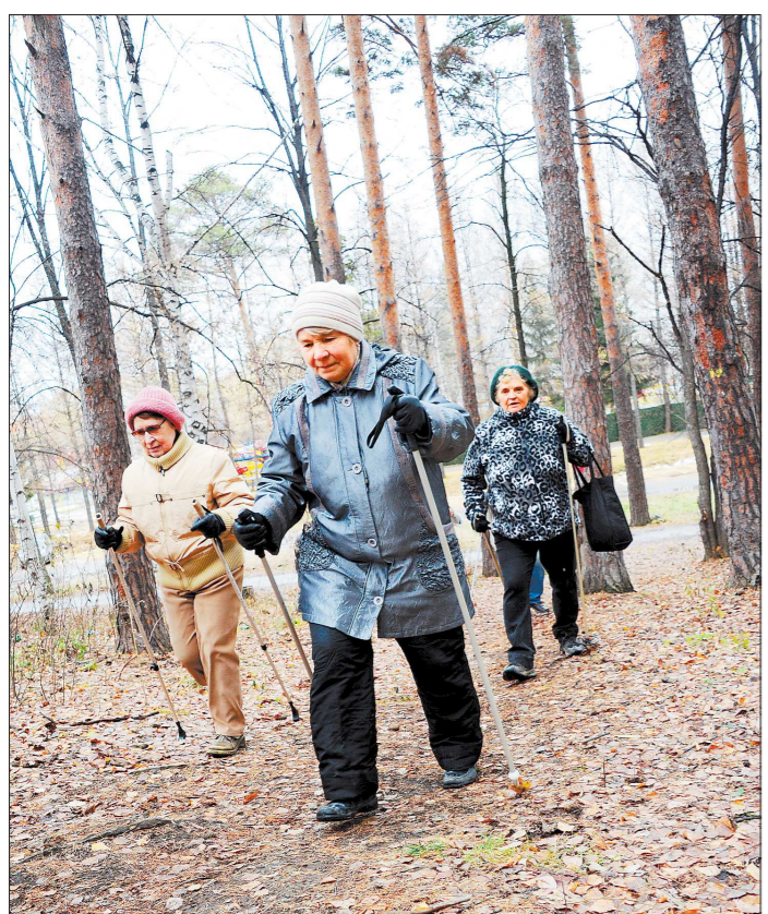
В скандинавский поход — уверенным шагом