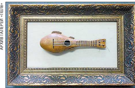
Португальская мачете из лондонского музея Хорнимана

Музыкальные инструменты из папье-маше и в миниатюре