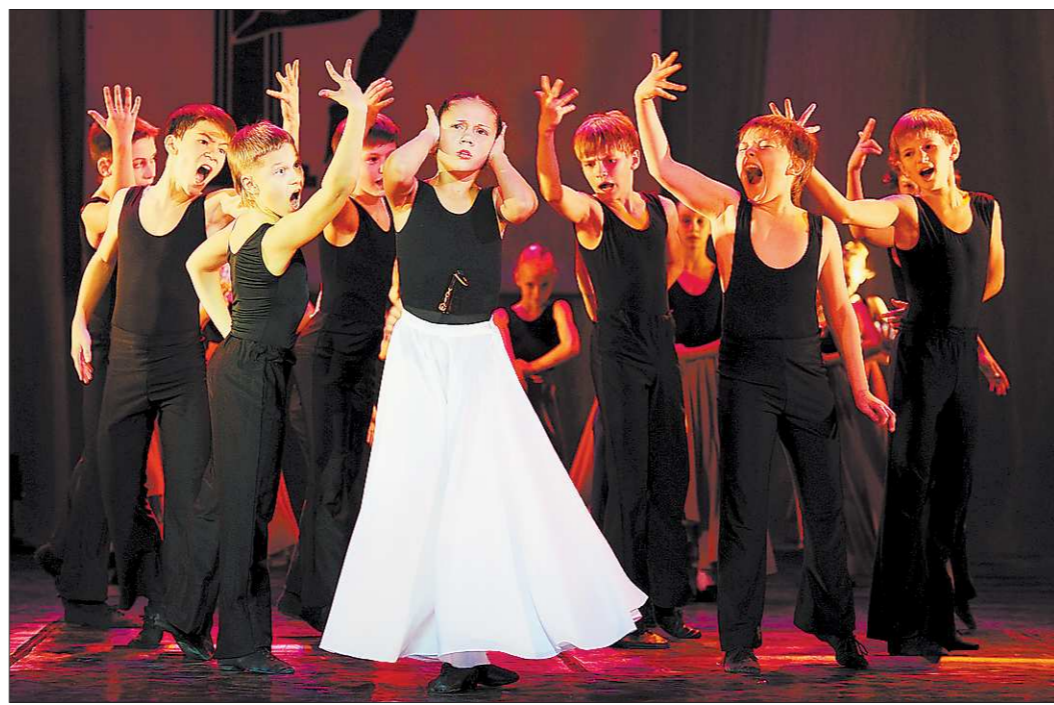
Точные в движениях и раскрепощённые в эмоциях танцоры «Улыбки» выплёскивают свою энергию в зал

Художественные руководители двух ансамблей, поделившись творческим опытом,