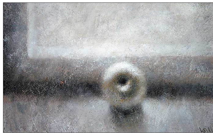
Иван Слюсарев «Садик зимой»