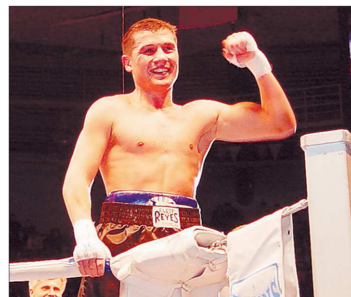
Победам земляков мы теперь будем радоваться чаще