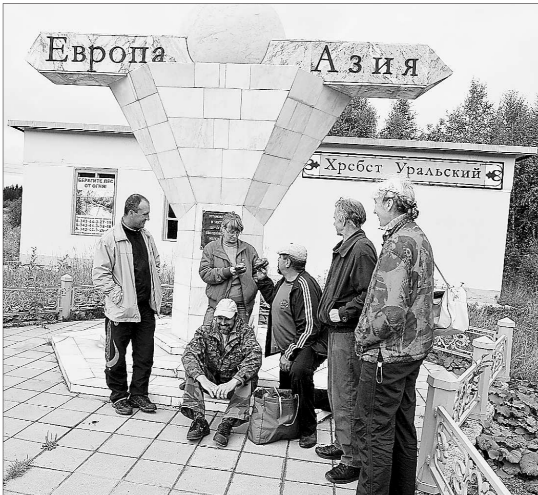
Здесьний вокзал — место встречи людей и частей света

Но вернёмся к табличке на воротах, порасспросим знато-