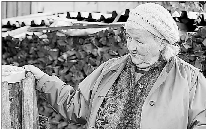
Клара Александровна вспоминает...