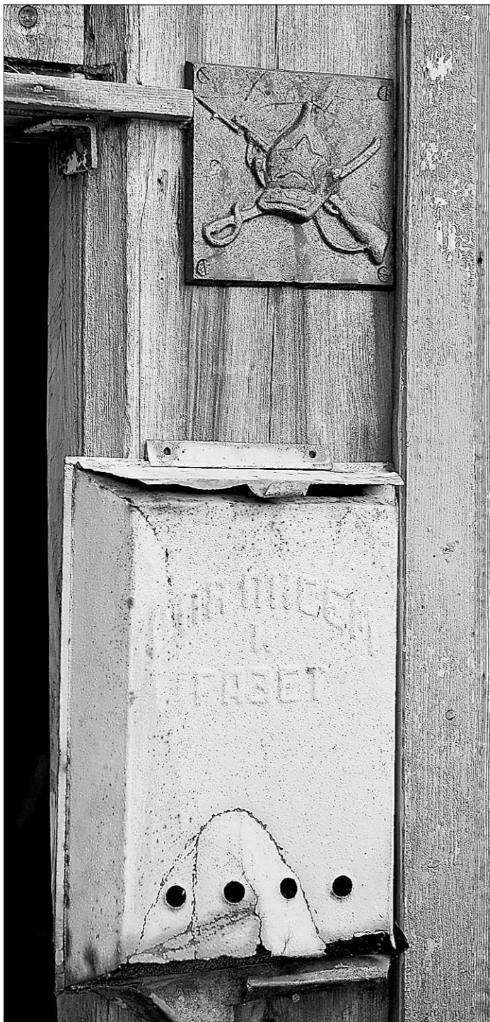
Знак на входе — как послание из далёких лет

Станция «Хребет Уральский» — место, сами понимаете, знаковое в прямом смысле этого слова: знаков, символизирующих границу частей света, здесь хватает. На перроне в 2003 году, в честь 125-летия Горноуральской железной дороги, установлена мраморная композиция в направлении восток и на запад стрелами-указателями. А непосредственно в год рождения железной магистрали, 1878-й, по обе стороны пути поставлены четырёхгранные пирамиды из тех же рель-