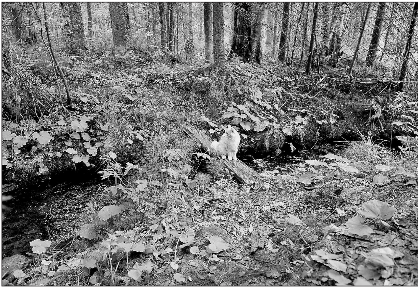
Река Тура. Здесь её и кошка перескочит

сов, что и сама «железка». Дюны от Хребта Уральского надо топтать по шпалам в сторону Европейской несколько километров. Так чтоazole тех знаков бывали только самые заядлые туристы — «пограничники».