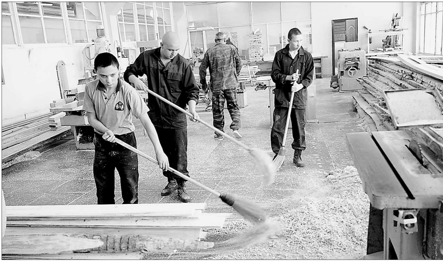
Последствия погрома воспитанники убирали сами

Событие недельной давности удивило своим масштабом. Как признаются педагоги, никто из них ничего