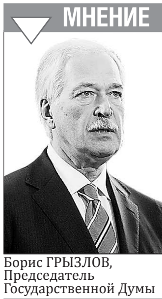
Борис ГРЫЗЛОВ, Председатель Государственной Думы