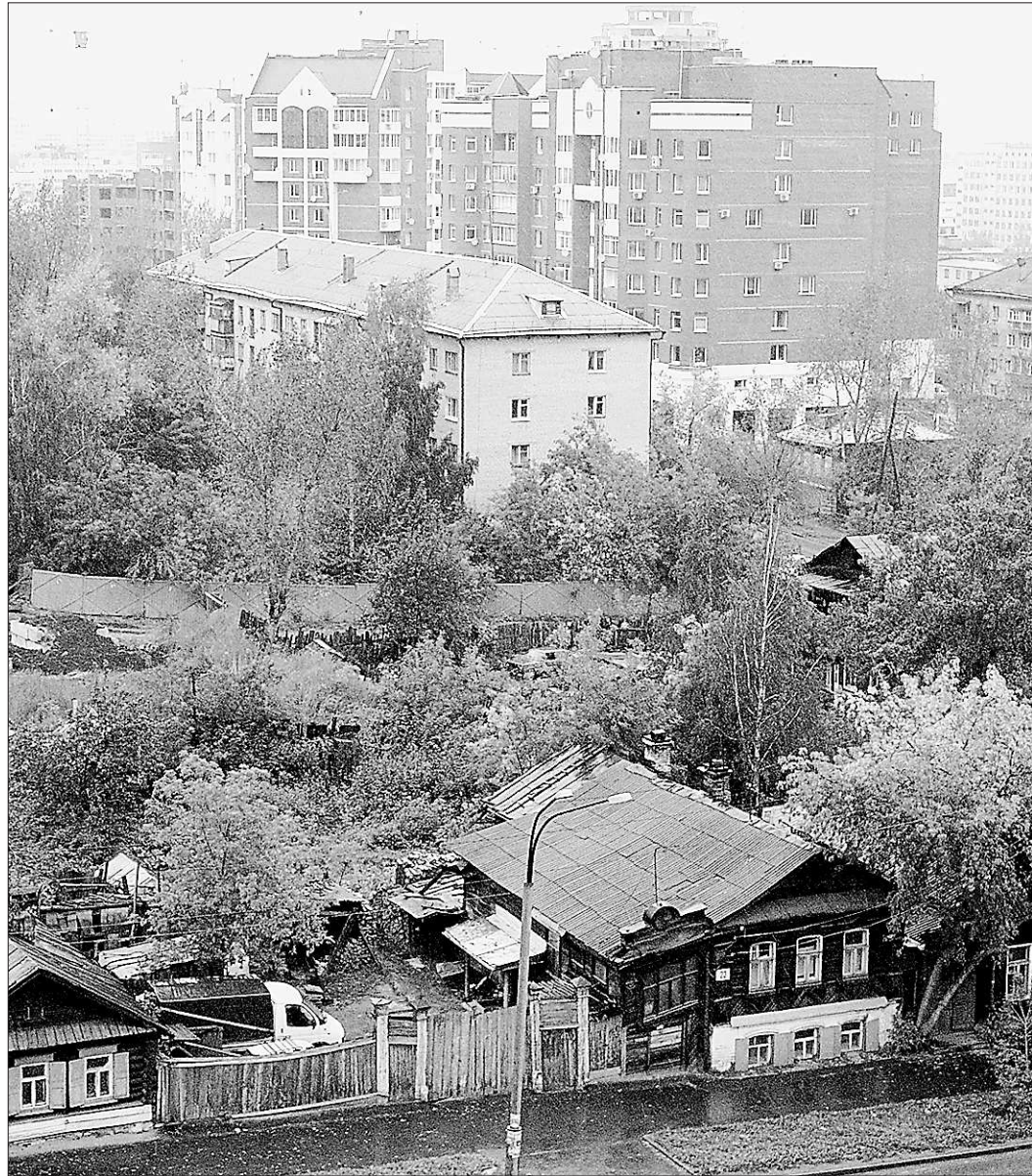
Частный сектор занимает 20 процентов территории Екатеринбурга. Хозяева домов не спешат перебираться в многоэтажки

В условиях нестабильности доллара и евро и невозможности предугадать, куда сейчас выгоднее вкладывать деньги,