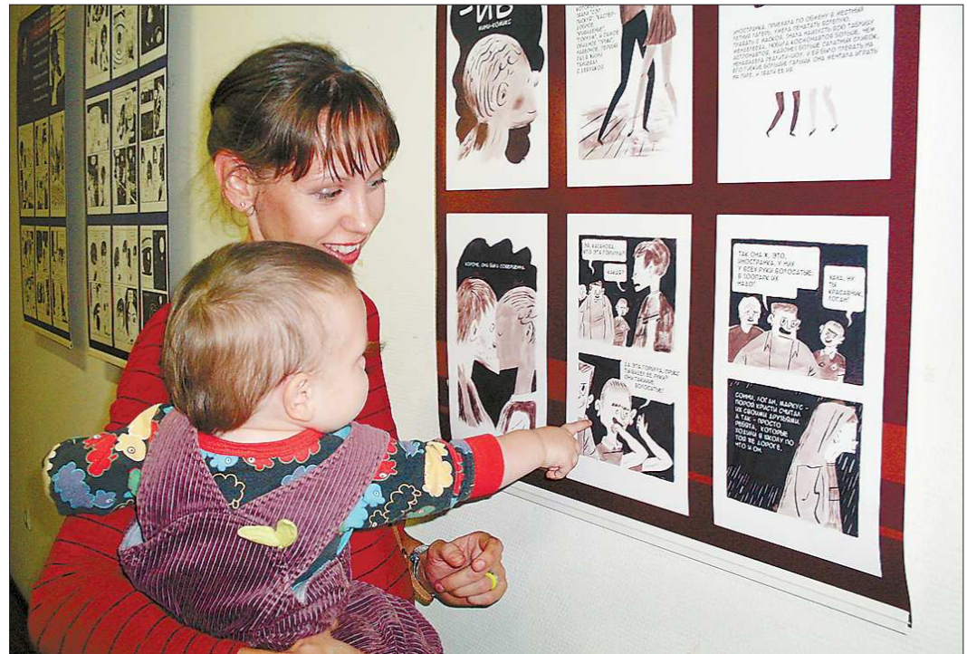
Комикс стал полноправным видом современного искусства, язык которого понятен детям и интересен взрослым