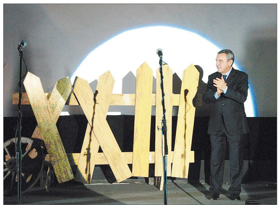
До XXIII фестиваля документального кино «Россия» осталось чуть меньше года

В Свердловской области реализуются крупные инвестиционные проекты, создаются химический, фармацевтический, приборостроительный, машиностроительный кластеры, высокотехнологичная отрасль становится и традиционной для нас металлургия. Развивается дорожная сеть, идёт подготовка к строительству высокоскоростных магистралей. В рамках проекта «Уральская деревня» создаются условия для эффективного развития сельского хозяйства.