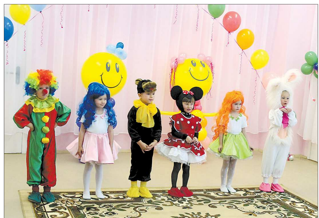
Какое же новоселье без концерта!