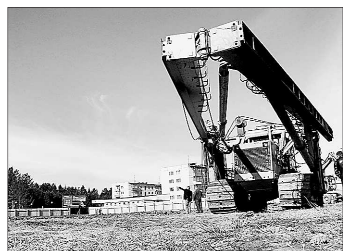
Сейчас строители работают над фундаментом, а к концу ноября планируют приступить к монтажу металлических конструкций

В четырёхэтажном здании помимо спортивных залов будут располагаться раздевалки душевые, массажные кабинеты и сауна. Для небольшого посёлка с населением 11 тысяч человек появление физкультурно-оздоровительного комплекса станет важным событием. Сейчас в Верхней Синячихе есть футбольное поле с искусственным покрытием, современные легкоатлетические беговые дорожки, однако отсутству-