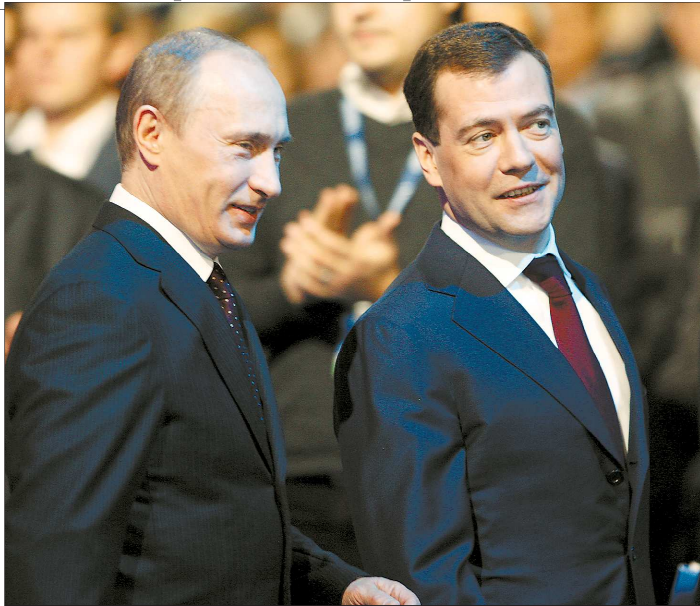
Съезд «Единой России» подтвердил прочность «тандема» Владимир Путин — Дмитрий Медведев