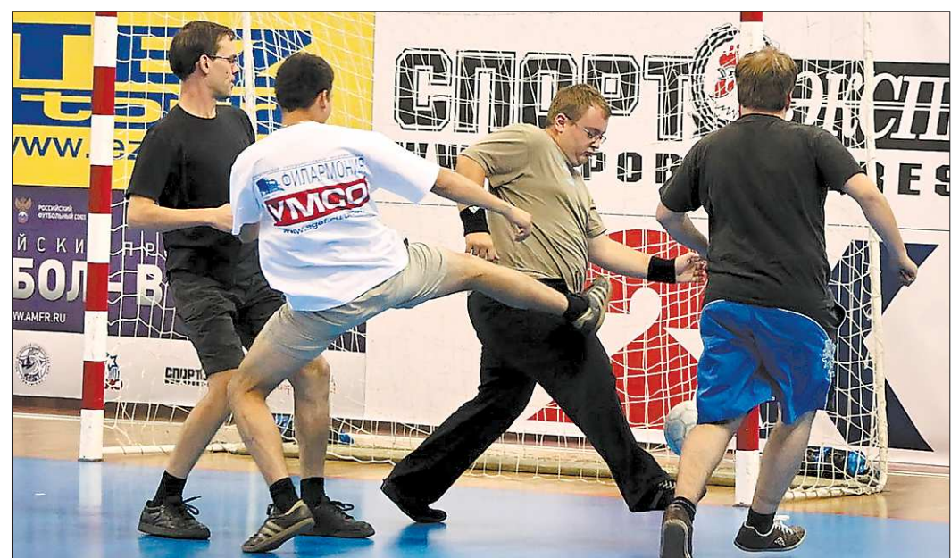
В футболе не в оркестре: играют только ногами