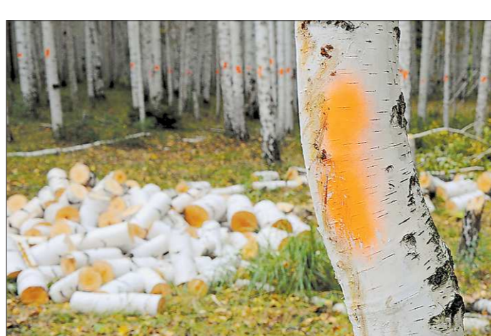
Где была роща, теперь пустошь

«Я бы не считал, что наша система права (я повторяю ещё раз — это континентальная система права, и в неё входят такие системы права, как право Германии, Франции, всей континентальной Европы) хуже, чем англо-американская система, а чем-то даже и лучше».