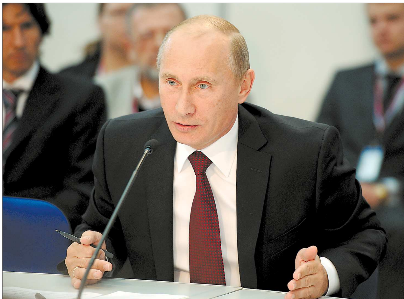
В работе одной из секций съезда принял участие Владимир Путин

То, что президент выступил за разработку новых экономических механизмов поддержки вузов — это хороший знак для российского студенчества. Когда есть проблемы с жильём, сложно думать об учёбе и науке.