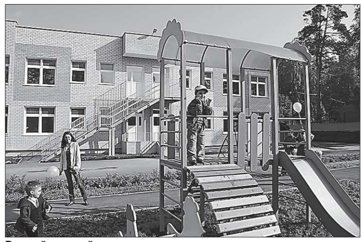
В такой детский сад ноги сами понесут