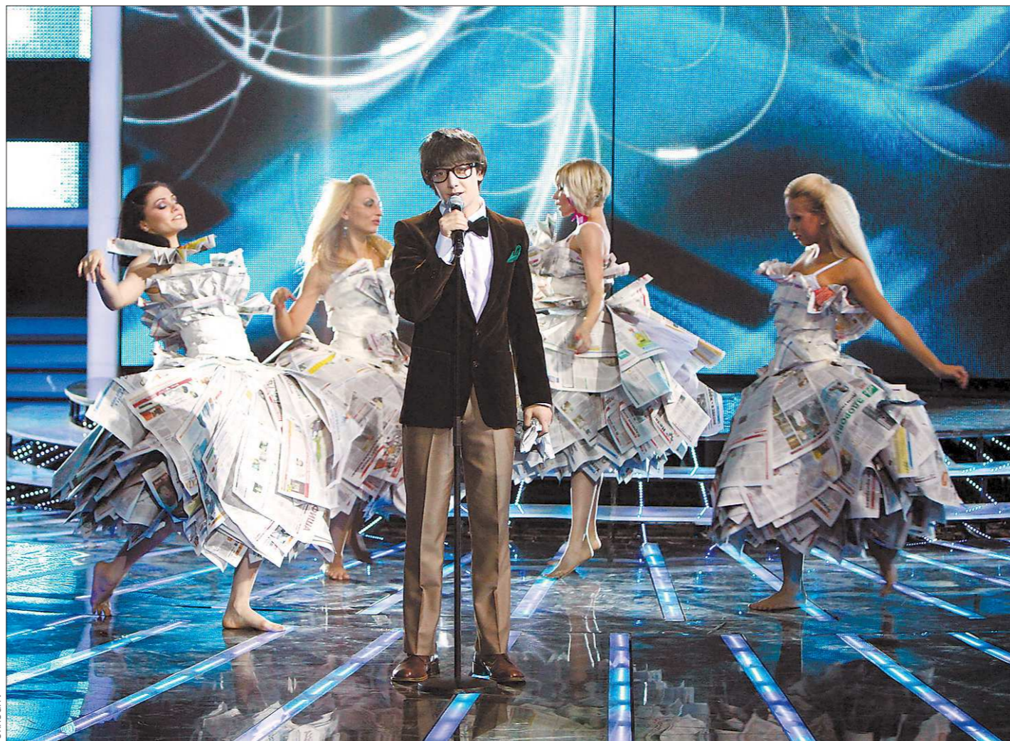
Победив на «Факторе А», Эркин сказал «а». Но в алфавите ещё очень много букв...

Теперь «Уралу» предстоит провести два матча на выезде: 22 сентября в Саранске и 25-го – в Набережных Челнах.