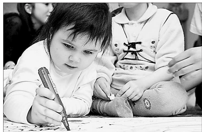
Шансы сирот решили «подравнять»

И то верно. На этой земле многое должно обладать осмысленной, но вредной для других, но всё же свободой. В том числе – огонь, вода и человек.