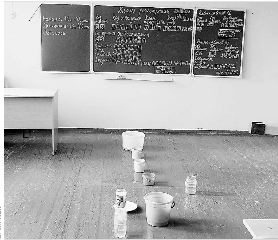
срок сдачи школы, поскольку пришлось бы проводить новые торги.

— Мы не можем влиять на выбор подрядчика. Сегодня этот вопрос решают электронные торги. Конкурс выиграла екатеринбургская фирма. В итоге ремонт начался очень медленно. Екатеринбургцы везли сюда на север свои инструменты, свои материалы и своих людей. Вместе с тем ремонт кровли — кропотливая работа, и сразу было понятно, что быстро её не проделают. Мы думали о том, чтобы просто сменить подрядчика, но это ещё больше затянуло бы