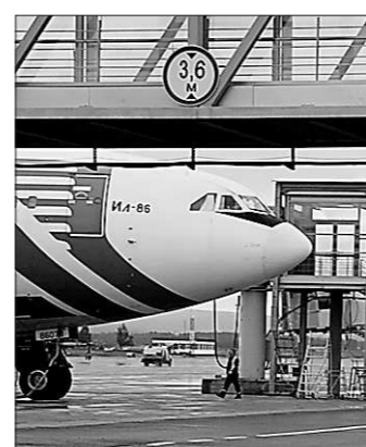
Так кто же останется «с носом»?

Также сообщается, что в настоящее время в аэропорту Екатеринбургa «имеется запас топлива, который обеспечит бесперебойную работу аэропорта в течение 5-7 дней. Законтрактовано уже 11,5 тысячи тонн из 14 необходимых на сентябрь. В частности, ОАО «Газпром-нефть» подтвердило дополнительную заявку ТЭК Кольцово на поставку в этом месяце трёх тысяч тонн авиакеросина». Беспочвенно по поводу нехватки топлива было выдвинуто тем, что накануне поставщики не полностью подтвердили направленные в их адрес заявки на сентябрь. Ссылаясь на отсутствие производственных мощностей и переориентацию по-