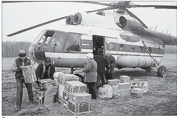
В августе почтовые вертолёты традиционно доставляют товары для школьников