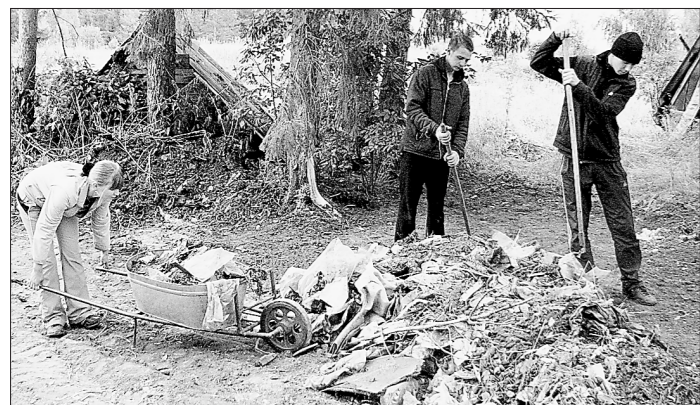
За сорок лет существования посёлка отсюда никогда не вывозились бытовые отходы